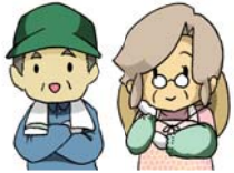
出し手 (農地所有者)