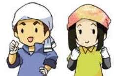
受け手 (地域の担い手等)